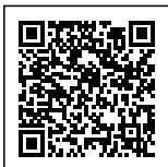
EFAN HASBULLAH NRK. 3050

Apabila dikemudian hari terdapat kekeliruan dalam pemberitahuan ini maka akan diadakan perbaikan sebagaimana mestinya.